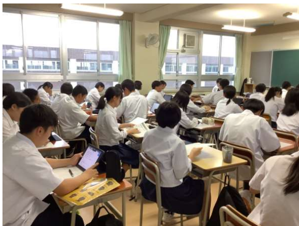
地域探究活動 地域について調べよう