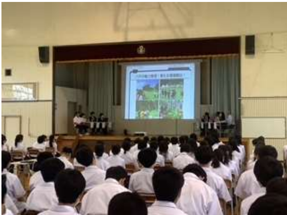
地域探究講演会パネルディスカッション